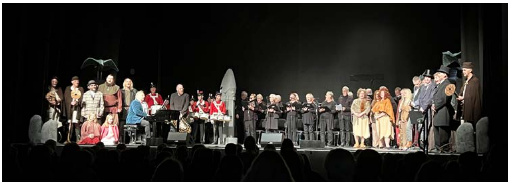
▲ Den skræddersyede Sigurd Barrett-forestilling om Vejens historie med særlig fejring af museets 100-års fødselsdag og 150-året for togbanen Lunderskov-Esbjerg – var en vellykket fusion af professionelle og de mange engagerede lokale medspillere. Tak til ALLE!