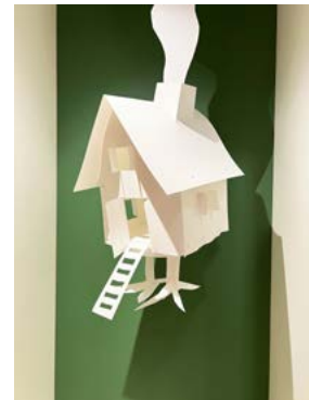
▲ Øverst ses papirløjdsfigurer af fiskerens båd og heksens hus. De findes i monterne til den 1. og 6. december.