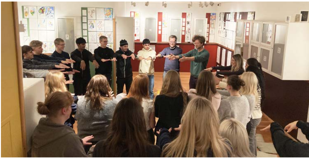
▲ Fra den 2. til den 20. december gæster over 800 børn og unge museumsformidlingen. Grupperne spænder fra 0. klasse til gymnasium og Vejen Business College.